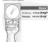
Teste de Dinamometria (Força Muscular)

13.7 Shuttle Run (Medido em Segundos e décimos de segundos)